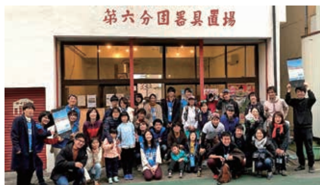
地域との連携・協働の取組（東伊豆町ダイロクキッチンにて）

この間、2008年には、生涯学習教育研究センターと並行して地域連携協働センターが設置され、また2012年にはイノベーション社会連携推進機構の設立に伴い、生涯学習教育研究センターと地域連携協働センターが統合して地域連携生涯学習部門へと改組されました。さらにセンター20周年を迎えた2017年10月には、