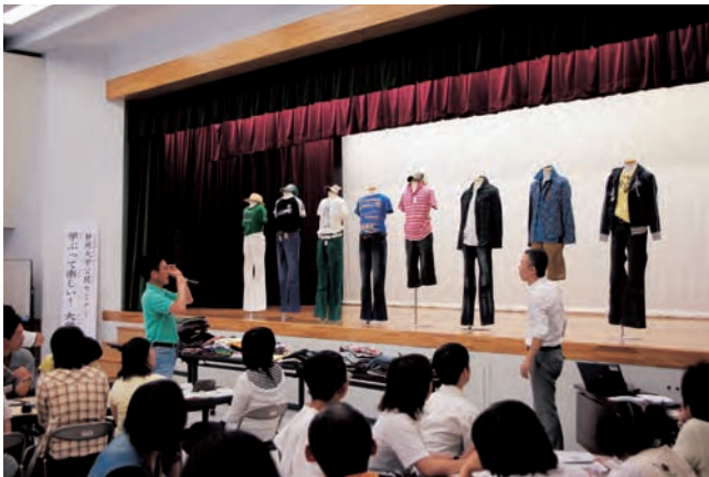
公開セミナー「学ぶって楽しい!」会場風景（現代ファッション事情）