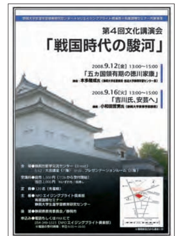
文化講演会「戦国時代の駿河」チラシ