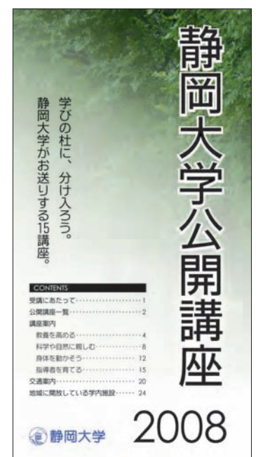
パンフレット(全24ページ)