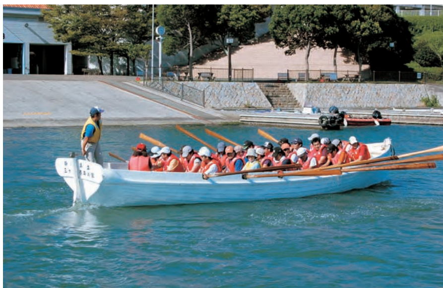
三ヶ日青年の家でのカッター訓練 (8/15)

研究集録として上梓された論文も、各人毎ではなく、グループの共同作業でまとめ上げられ提出されます。読み合わせ、互いによる批評・助言、全体へのまとめあげなど、このために受講生と演習講師が費やした時間と労力は大変なものですが、それによって得たものも多々あるように感じられます。遠慮のない批判を通じて得られる自己の客観化、様々な背景を持ちながら対等な立場で進められるチームワーク、そして協力して学び合うことの充実感。何よりこの講習・演習で作上げられたネットワークは、各受講生にとって公私ともども大きな財産になるのではないかと思います。